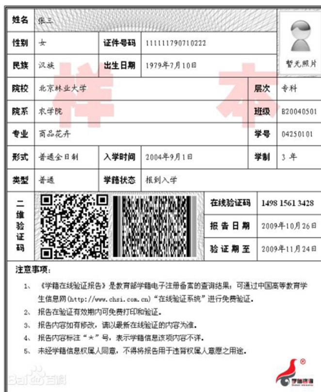
教育部学籍在线验证报告

5.区内成人应届本科毕业生须上传“中国高等教育学生信息网”的《教育部学籍在线验证报告》，报告验证有效期须在 2020 年 11 月 1 日之后。